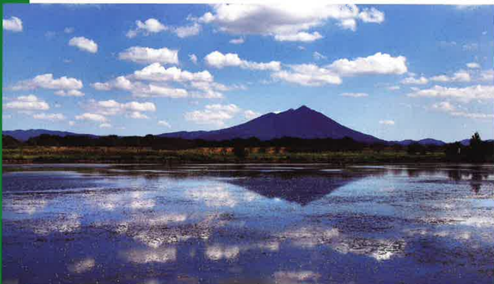
筑西市から見た秋の筑波山