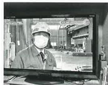
各メディアからの取材に協力し、企業と地域についてPRしている。

弊社は「モノづくり」の会社ですが、今後は「コトづくり」、「ブランド化」を推し進め、「ニッチトップ」として地域に根付く、この業界でのイニシアティブを目指して行きます。更にサポインの「企業化ブラッシュアップ」に選ばれ、多くの川下企業のアドバイザーの承認を頂き、申請の採択に向け活動中です。地元ロータリークラブの講演や古河中等教育学校での講演活動を継続し、地域の活動向上の礎としていきたいと思います。