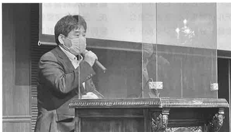
挨拶に立つ藤澤青年経営研究会会長

における旅客運送業の役割を熟知しており、交通のエキスパートとしてご活躍。現在は、茨城県議会議員として、本県の政策づくりにご尽力され、特にタクシーやバスの無人運転化をはじめ、交通の改革に既に着手しており、つくばを国内先端の自動運転モデル地域ととらえ、関係企業や研究機関との間で連携を構築。講演では、つくばエクスプレス北部延伸論等についてお話いただいた。