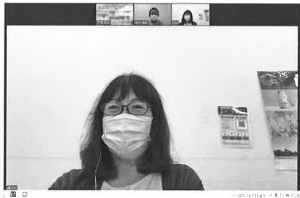
Zoomによる相談会の模様