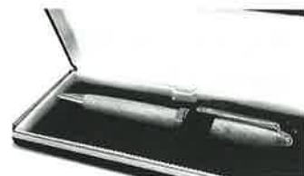
高萩ブランドの推奨爺杉ペン

この地域の社会貢献に繋がるようなことがあれば積極的に活用して行きたいと考えています。弊社に訪問されるお客様には、県北地域や高萩市をあまりご存知ない方が多いため、ご訪問頂いた際にはこの地域の歴史や観光についてもPRして行きたい。