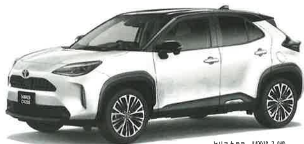
ヤリスクロス HYBRID 2.0HD